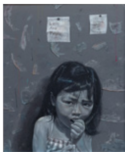
colorful / 606mm×500mm