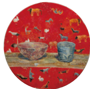
515 / 400mm×400mm