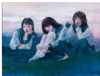
18歳 / 652mm×530mm