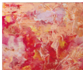
踊り子 / 727mm×606mm