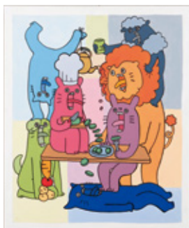
混沌の食卓 / 727mm×606mm