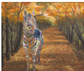
求心 / 727mm×606mm