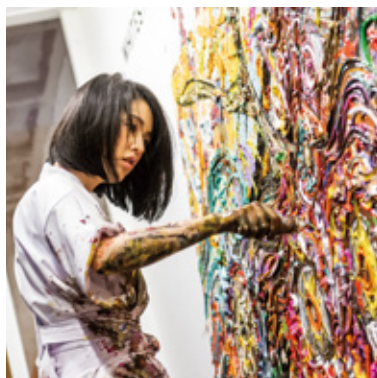
小松 美羽 現代アーティスト