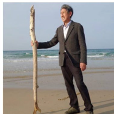
坂口 寛敏 東京藝術大学 名誉教授